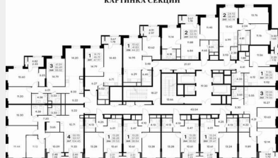
ПЛАНИРОВОЧНОЕ РЕШЕНИЕ КВАРТИРЫ